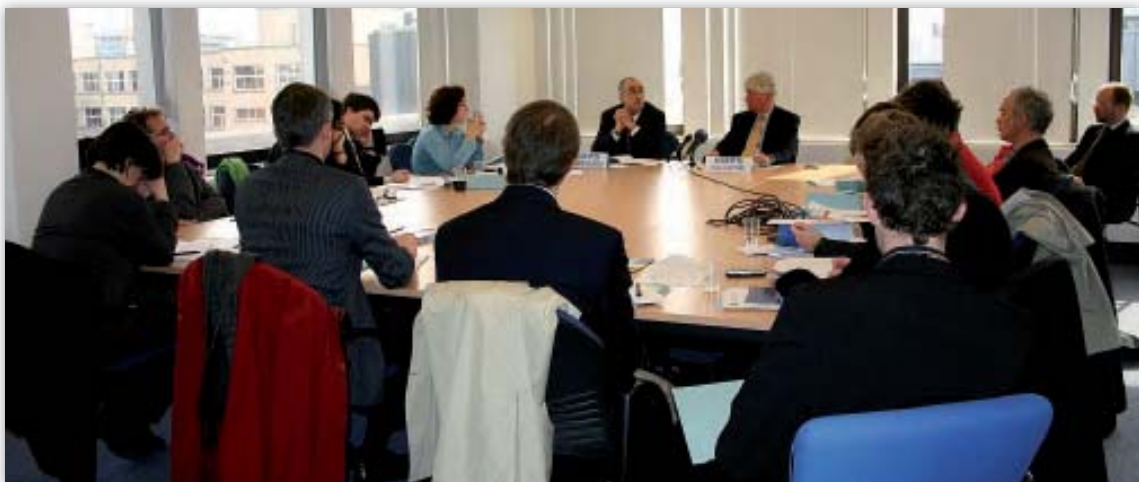
Οι Peter Hustinx και Joaquín Bayo Delgado παρουσιάζουν την ετήσια έκθεση για το 2005 κατά τη διάρκεια διάσκεψης τύπου.

Ο ΕΕΠΔ συνέχισε να επενδύει σημαντικό χρόνο και προσπάθεια στην αποσαφήνιση της αποστολής του και στην ευαισθητοποίηση όσον αφορά την προστασία των δεδομένων γενικά, καθώς και σε σειρά ειδικών θεμάτων, δίνοντας διαλέξεις και με παρόμοιες συμβολές σε διάφορα όργανα και σε διάφορα κράτη μέλη καθ' όλη τη διάρκεια του έτους. Παραχώρησε επίσης αρκετές συνεντεύξεις σε σχετικά μέσα μαζικής ενημέρωσης.