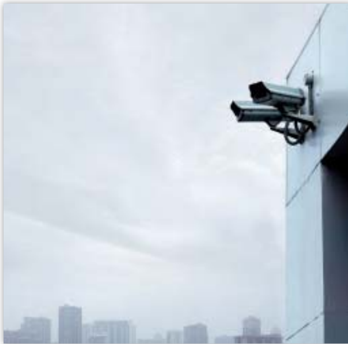
Ο αριθμός παρακολούθησης με βιντεοκάμερες έχει αυξηθεί τα τελευταία χρόνια.

Στο έντυπο αίτησης για κάρτα εκπροσώπου των ομάδων συμφερόντων αναφερόταν εμμέσως ότι είναι υποχρεωτικό να συμπληρωθεί η διεύθυνση κατοικίας. Πιο πέρα στο έγγραφο αναφερόταν ότι οι πληροφορίες που ακολουθούσαν δεν θα δημοσιοποιούνταν, υπονοώντας κατ' αυτόν τον τρόπο ότι οι προηγούμενες πληροφορίες —όπως η διεύθυνση της ιδιωτικής κατοικίας— θα δημοσιεύονταν.