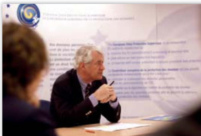
Ο Peter Hustinx κατά τη διάρκεια συνάντησης με μέλη του προσωπικού