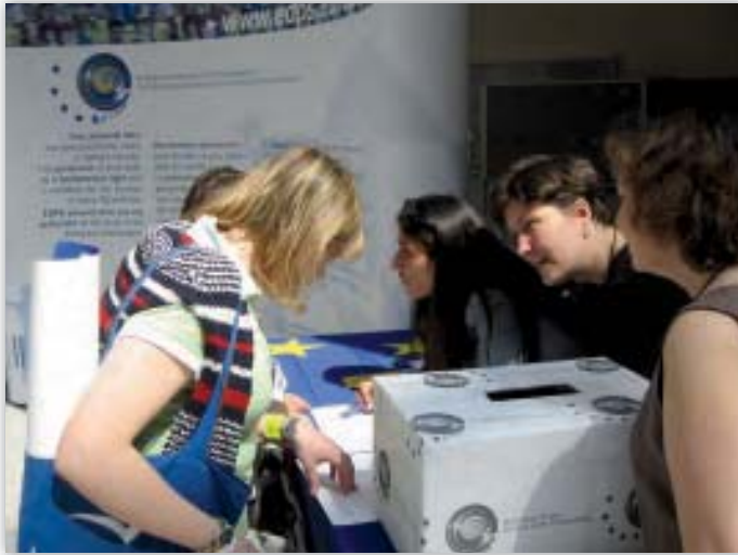
Προσωπικό του ΕΕΠΔ στο περίπτερο του ΕΕΠΔ που τοποθετήθηκε μέσα στο Ευρωπαϊκό Κοινοβούλιο κατά τη διάρκεια της «ημέρας ανοικτών θυρών του 2006» στις 6 Μαΐου 2006.

και περισσότερα από 200 άτομα συμμετείχαν σε ένα διαγωνισμό γνώσεων για θέματα προστασίας των δεδομένων, ο οποίος ενέπνευσε συζητήσεις σχετικά με την προστασία της ιδιωτικής ζωής και των δεδομένων στην Ευρώπη.