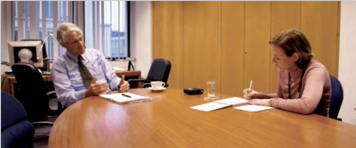
Ο Peter Hustinx δίνει συνέντευξη σε μία δημοσιογράφο.

Ο αναπληρωτής ΕΕΠΔ προέβη σε ανάλογες παρουσιάσεις στη Βουδαπέστη, στη Βαρσοβία, στη Μαδρίτη και τη Βαρκελώνη, μεταξύ άλλων προς την ισπανική Σχολή Δικαστών, σχετικά με την προστασία των δεδομένων στο πλαίσιο του τρίτου πυλώνα.