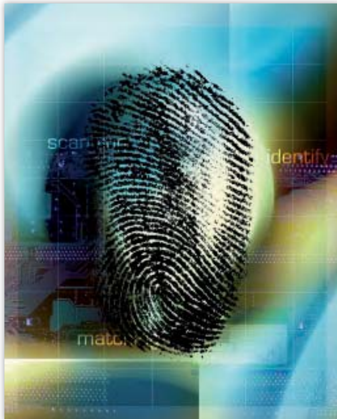
Η κεντρική βάση δεδομένων του Eurodac περιέχει περισσότερα από 250 000 δακτυλικά αποτυπώματα.

Με δεδομένες αυτές τις ευθύνες, πραγματοποιήθηκαν τακτικές συνεδριάσεις και άτυπες επαφές μεταξύ του ΕΕΠΔ και των υπηρεσιών της Επιτροπής