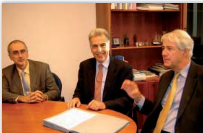
Οι Peter Hustinx, Π. Νικηφόρος Διαμαντούρος και Joaquín Bayo Delgado μετά την υπογραφή μνημονίου συμφωνίας μεταξύ του Ευρωπαϊού Διαμεσολαβητή και του ΕΕΠΔ.

εται με την επεξεργασία δεδομένων προσωπικού χαρακτήρα. Κατά συνέπεια, οι καταγγελίες που υποβάλλονται στο Διαμεσολαβητή ενδέχεται να περιλαμβάνουν θέματα προστασίας των δεδομένων. Ομοίως, οι ενστάσεις που κατατίθενται στον ΕΕΠΔ ενδέχεται να συνδέονται, στο σύνολό τους ή εν μέρει, με καταγγελίες για τις οποίες έχει ληφθεί ήδη απόφαση του Διαμεσολαβητή.