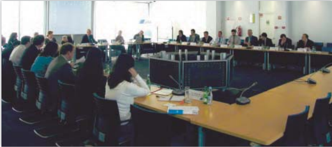
Evropský inspektor ochrany údajů na zasedání Sítě inspektorů ochrany údajů v Lisabonu (Portugalsko)

EIOÚ se zúčastnil části každého jednání, které mezi inspektory ochrany údajů proběhlo v březnu (Soudní dvůr, Lucemburk), v červnu (Evropské monitorovací centrum pro drogy a drogovou závislost EMCDDA, Lisabon) a v říjnu (EIOÚ, Brusel). Tato jednání byla pro EIOÚ vhodnou příležitostí informovat inspektory ochrany údajů o práve probíhajících činnostech a projednat otázky společného zájmu. EIOÚ využil těchto jednání k vysvětlení postupu při předběžných kontrolách a některých hlavních pojmů nařízení týkajících se předběžných kontrol (např. správce, zpracování) a k diskuzi o nich. Jednání rovněž umožnila EIOÚ zdůraznit pokrok, k němuž došlo v souvislosti s jednotlivými případy předběžné kontroly, a poskytnout podrobné informace o některých zjištěních vyplývajících z činnosti spojené s předběžnými kontrolami (viz bod 2.3 níže). Spolupráce mezi EIOÚ a inspektory ochrany údajů se tedy i nadále rozvíjela velmi slibně.