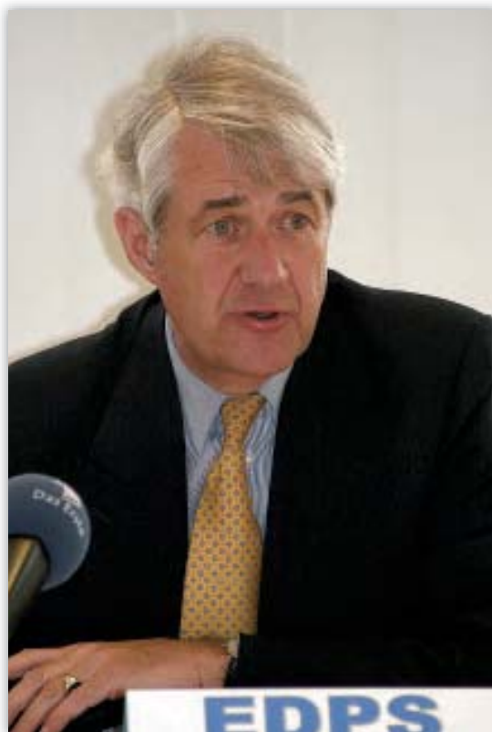
Peter Hustinx na tiskové konferenci

V roce 2006 bylo nejvíce pozornosti věnováno dvěma návrhům projednávaným v Radě. Prvním návrhem byl návrh rámcového rozhodnutí o ochraně údajů v rámci třetího pilíře vypracovaný Komisí, ke kterému vydal EIOÚ dne 19. prosince 2005 stanovisko. Dne 24. ledna 2006 bylo na konferenci evropských orgánů pro ochranu údajů rovněž přijato stanovisko, které se shodovalo se stanoviskem EIOÚ. Druhým návrhem byl návrh rámcového rozhodnutí o výměně informací