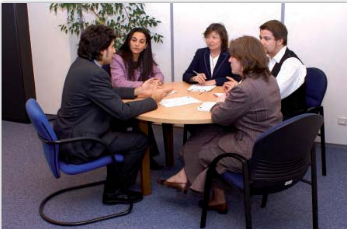
Porada zaměstnanců oddělení pro lidské zdroje, správu a rozpočet