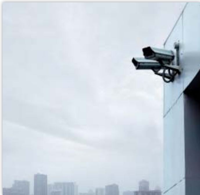
Počet bezpečnostních kamer vzrostl v posledních letech

Jedna ze stížností byla podána proti Evropskému parlamentu (2006–95) v souvislosti s případným zveřejněním soukromých adres akreditovaných lobbistů. V žádosti o identifikační průkaz lobbisty bylo vyžadováno uvedení soukromé adresy. Níže v žádosti bylo uvedeno, že informace, jež následují, nebudou zveřejněny, což ovšem vedlo k závěru, že předcházející informace, včetně soukromé adresy, zveřejněny budou.