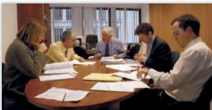
Diskuse zaměstnanců poradenského odboru týkající se připravovaného legislativního stanoviska

Dalším významným tématem, jímž se EIOÚ zabýval v rámci horizontálních otázek, je kvalita údajů. Aby se zabránilo nejasnostem v souvislosti se zpracovávanými informacemi, musí být zajištěna vysoká míra přesnosti údajů. Je tedy důležité, aby byla přesnost údajů pravidelně a řádným způsobem kontrolována. Kromě toho vysoká úroveň kvality údajů je nejen základní zárukou pro subjekt údajů, ale přispívá i k účinnému použití údajů osobou, která zpracování provádí.