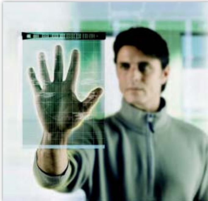
Sledování nových technologických vývojových trendů, které mohou mít dopad na ochranu osobních dat, je součástí poslání evropského inspektora ochrany údajů

V předchozí výroční zprávě poukázal EIOÚ na nové technologie, jako je zařízení pro radiofrekvenční identifikaci, biometrie a systémy správy identity, u kterých se očekává, že budou mít velký vliv na ochranu údajů. Příhodné určení nejlepších dostupných technik s cílem zaručit ochranu soukromí a bezpečnost v rámci těchto nových technologií bude rozhodující pro jejich přijetí konečnými uživateli i pro konkurenceschopnost evropského průmyslu.