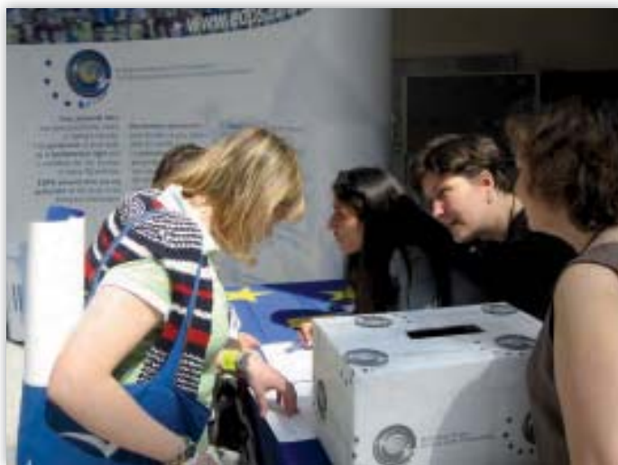
Informační stánek Evropského inspektora ochrany údajů na Dni otevřených dveří v Evropském parlamentu dne 6. května 2006

Pro den otevřených dveří i pro jiné příležitosti byl připraven stánek a menší propagační materiály (pera, samolepící bločky a flashdisky). Stánek EIOÚ byl umístěn v budově Evropského parlamentu a více než 200 lidí se zúčastnilo kvízu o záležitostech ochrany údajů, který vedl k diskusi o ochraně soukromí a údajů v Evropě.